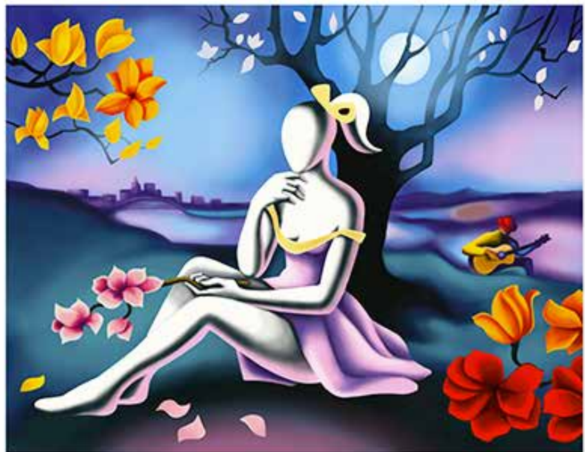
“MOONLIGHT AND MAGNOLIA” 68x59 CM