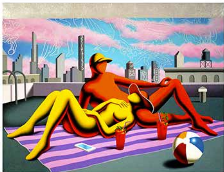
“THE SILVER LINING” 48x43 CM