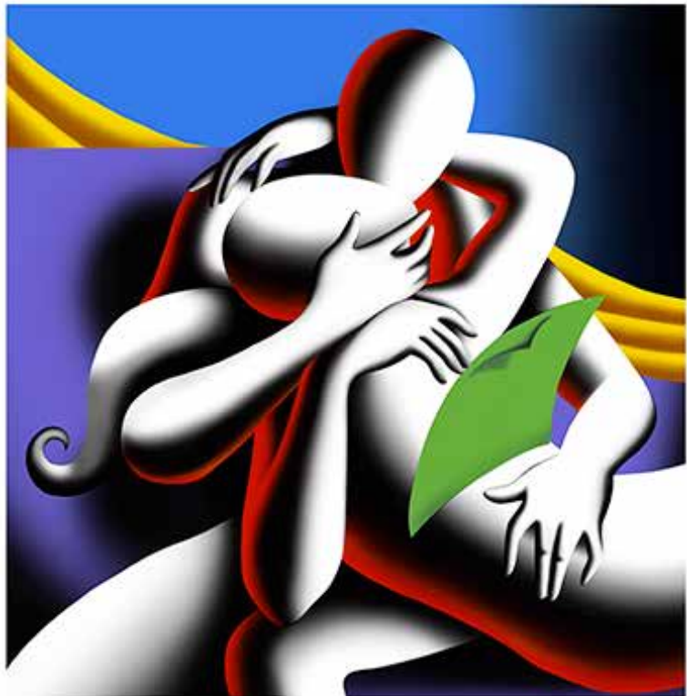
“TRANSCENDING THE MATERIAL” 60X64-CM