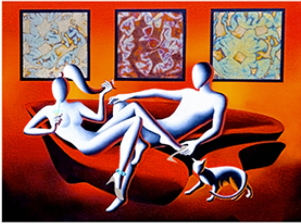
"CONFORT ZONE" 33x31 CM