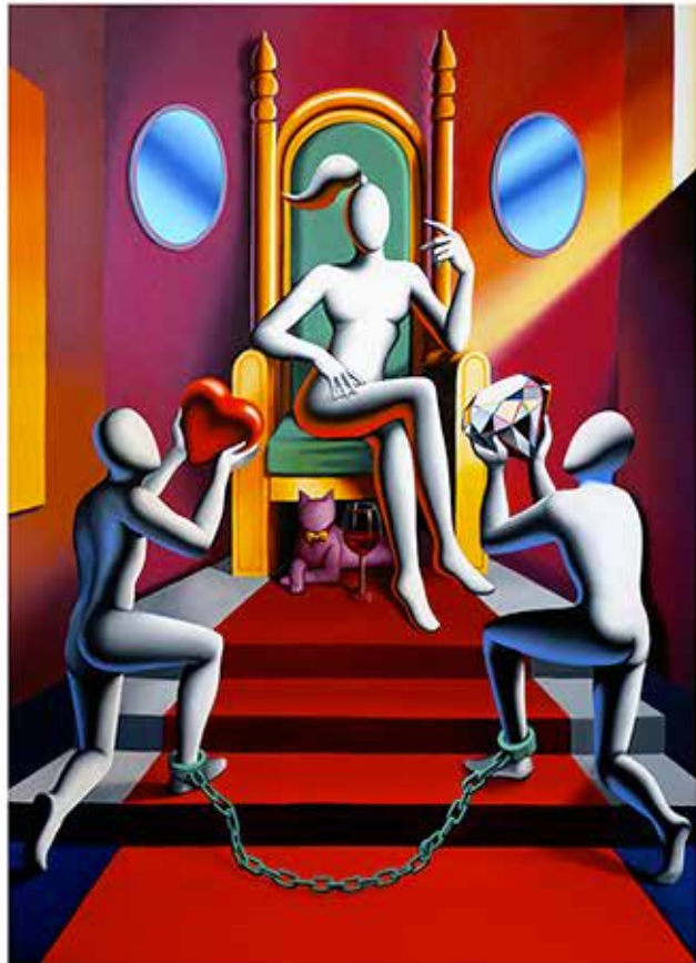
“DESIRE AND PERSUASION” 43X56 CM