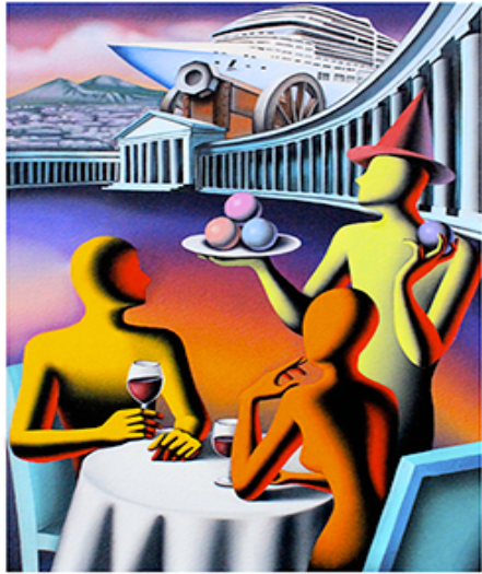
“THE GOOD LIFE“ 28X36 CM