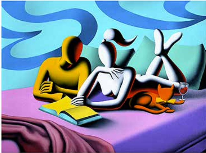
“DOMESTIC BLISS” 59x49