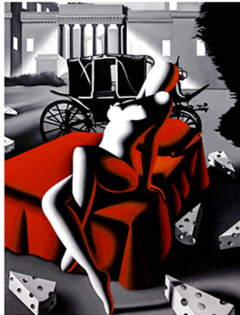
“DESIRE IN TREIA” 31X39 CM