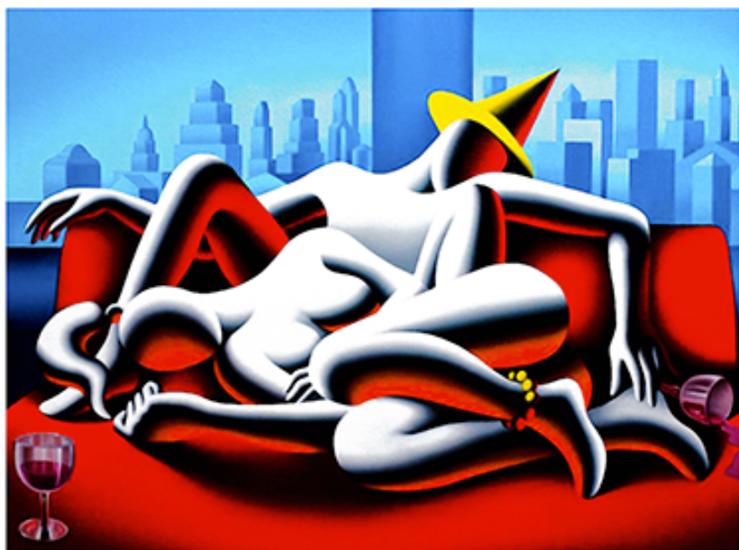
“BEYOND ECSTASY” 59x49 CM