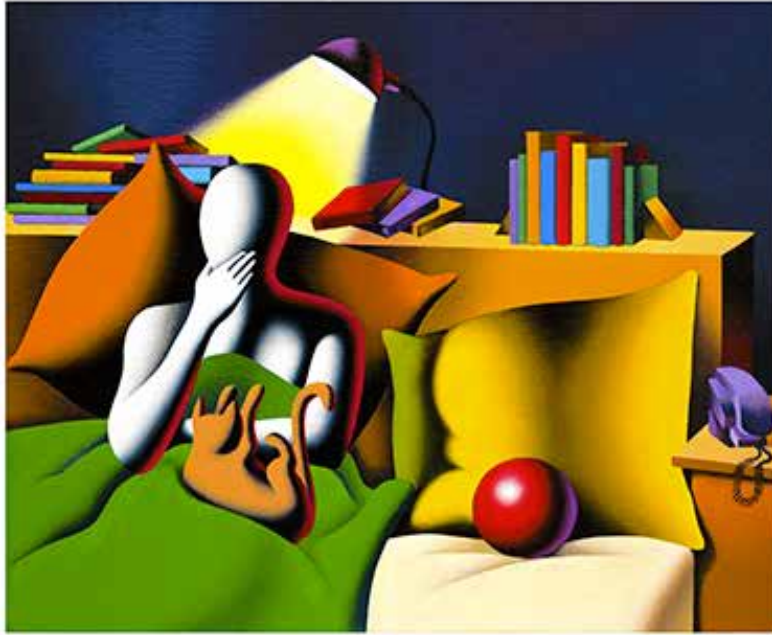
“BOOKS FOR COMPANY” 57x63 CM