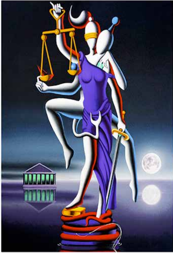
“ALWAYS GETTING HIS WAY” 48X63CM