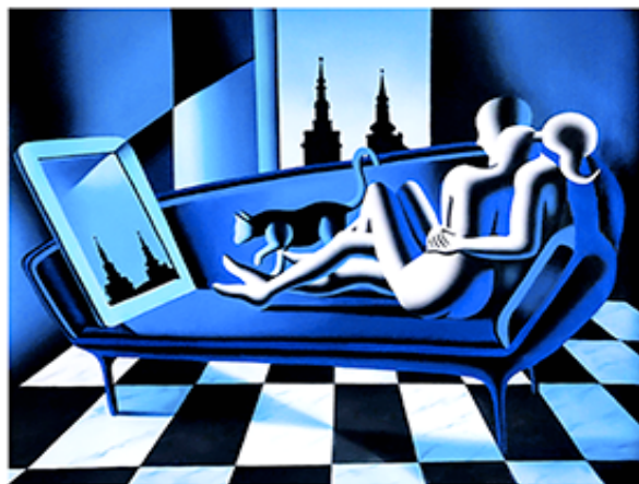
“PERCEPTION AND REALITY” 32x32 CM