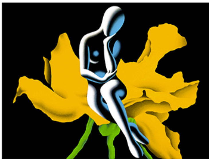
“EUPHORIC DEVOTION” 52x44 CM