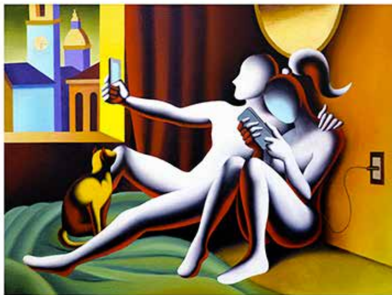
"SELF AWARENESS" 54x47 CM