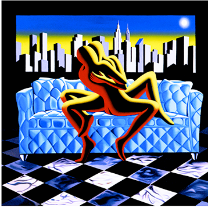
“URBANISTICA BLISS” 54x57 CM