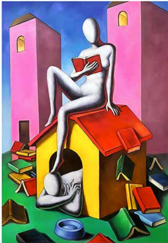
“PINK DOMINATION” 54x70 CM