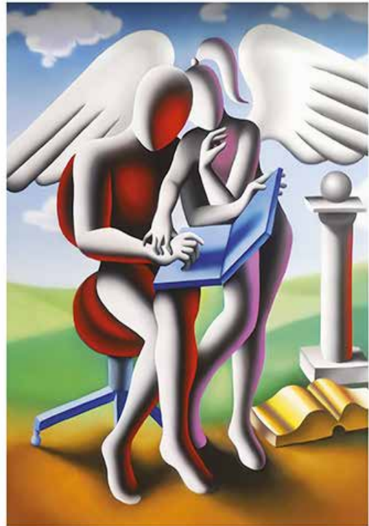
"DIVINE GUIDANCE" 56x70 CM