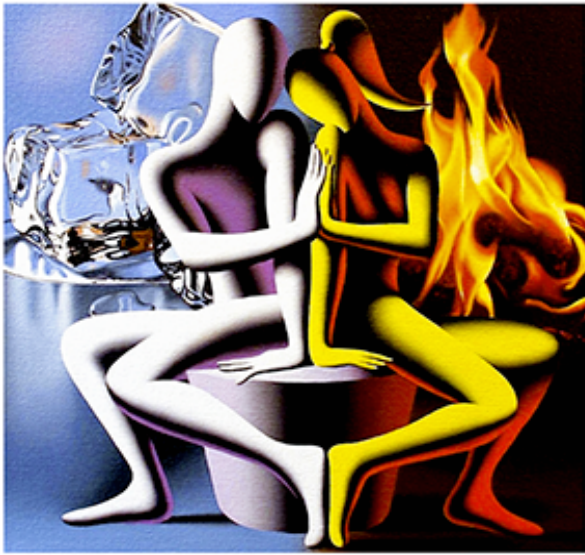
“EMBRACIN DIVERSITY” 34x37 CM