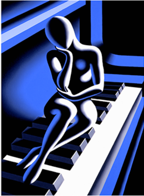
“IL SUONO DELLA MENTE” 30X40 CM