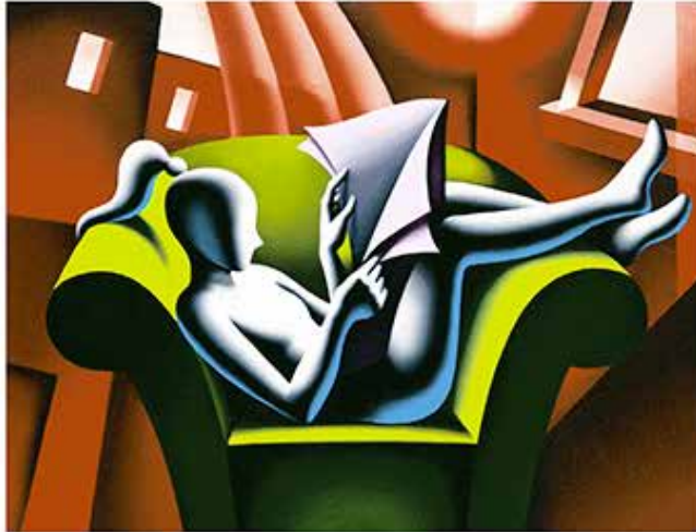
“THE LAST WORLD” 47x43 CM